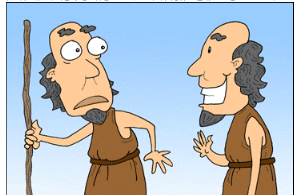
FIRST SAMUEL MEETS SECOND SAMUEL